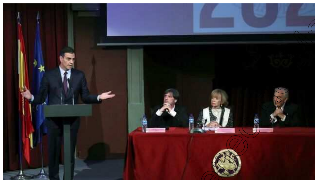
Sánchez recuerda a Tomás y Valiente para apelar a concordia frente al ruido

El presidente del Gobierno, Pedro Sánchez, ha recordado la figura del jurista Francisco Tomás y Valiente, asesinado por ETA en 1996, para apelar a la concordia frente al "ruido".